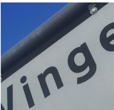
Vinge - Fremtidens by

Det er fastsat i ”Lokalplan nr. 153, For boliger i Sø kvarteret og i Solsikken i Vinge”, som kan udleveres ved henvendelse til EDC Poul Erik Bech eller på Frederikssund Kommunes hjemmeside www.frederikssund.dk