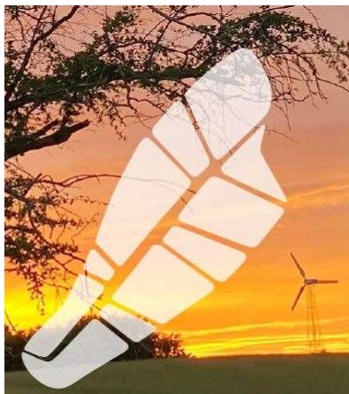
Bæredygtighed i fokus