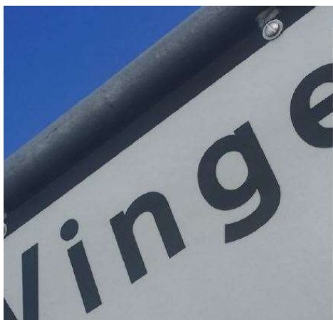
Vinge - Fremtidens by

Bankgarantien skal opdeles i 2 dele, hvoraf kr. 188.000 af restkøbesummen skal stilles overfor grundejerforeningen og resten skal stilles overfor Frederikssund Kommune. Se mere under afsnittet om grundejerforening.